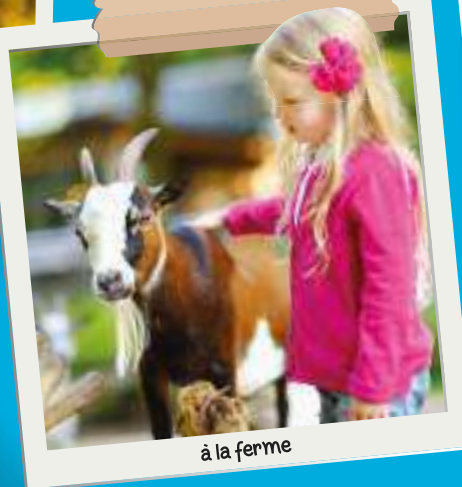
à la ferme

Séjours multi-activités, sportifs, linguistiques en France et à l'étranger