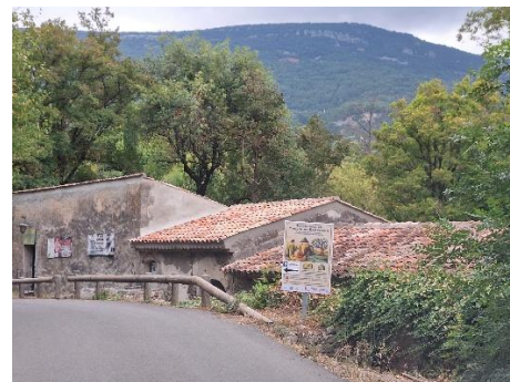
Toiture extérieure après

Et cela ne fait que commencer ! On continue sa rénovation