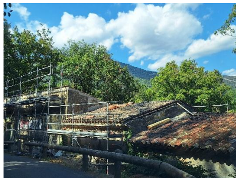
Toiture extérieure avant

Après 3 mois de travaux, enfin la toiture est totalement refaite sur la partie moulin et en couverture sur la partie ressence.